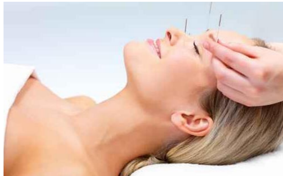
Ein kleiner „Pieks“ mit großer Wirkung – professionelle Akupunktur kann Schmerzen lindern

Sie brauchen also eigentlich nichts weiter zu tun als abzuwägen, ob Sie lieber einen kleinen kurzen „Piecks“ haben wollen, oder ob Sie lieber die Gefahr in Kauf nehmen, sich lange herum zu quälen. Und wenn Sie Ihren Körper fragen würden? Der würde sich in jedem Falle für die Akupunktur entscheiden. Er mag Betäubungsmittel nämlich überhaupt nicht.