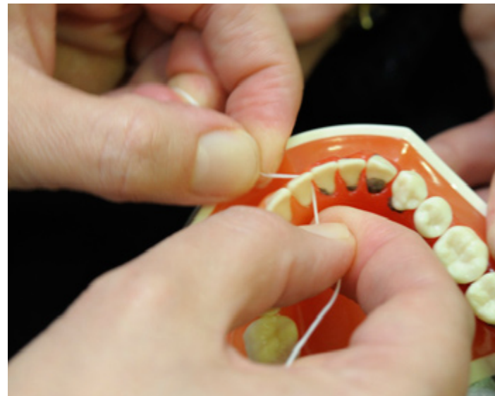
Auch bei der Zahnseide kommt es auf die richtige Anwendung an, um die optimale Wirkung zu erzielen.

Patienten, dass sie ein tolles, frisches Mundgefühl haben und dass sie mit der Zunge über herrlich glatte Zähne fahren können.